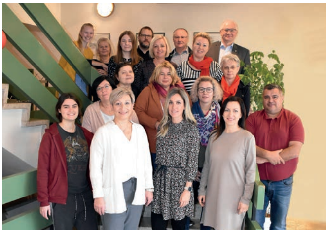
Das Team der Stadtgemeinde Mattersburg steht Ihnen für jegliche Serviceleistungen gern zur Verfügung!