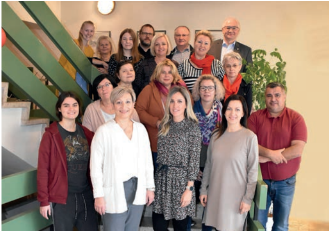
Das Team der Stadtgemeinde Mattersburg steht Ihnen für jegliche Serviceleistungen gern zur Verfügung!